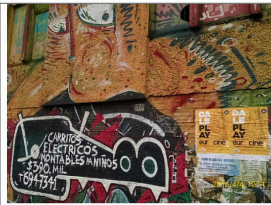
Av. Caracas No. 22-84