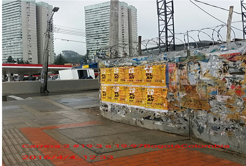
Fotografía 6. Cerramiento de la Calle 20 con Carrera 3

ALCALDÍA MAYOR DE BOGOTÁ D.C. SECRETARÍA DE AMBIENTE