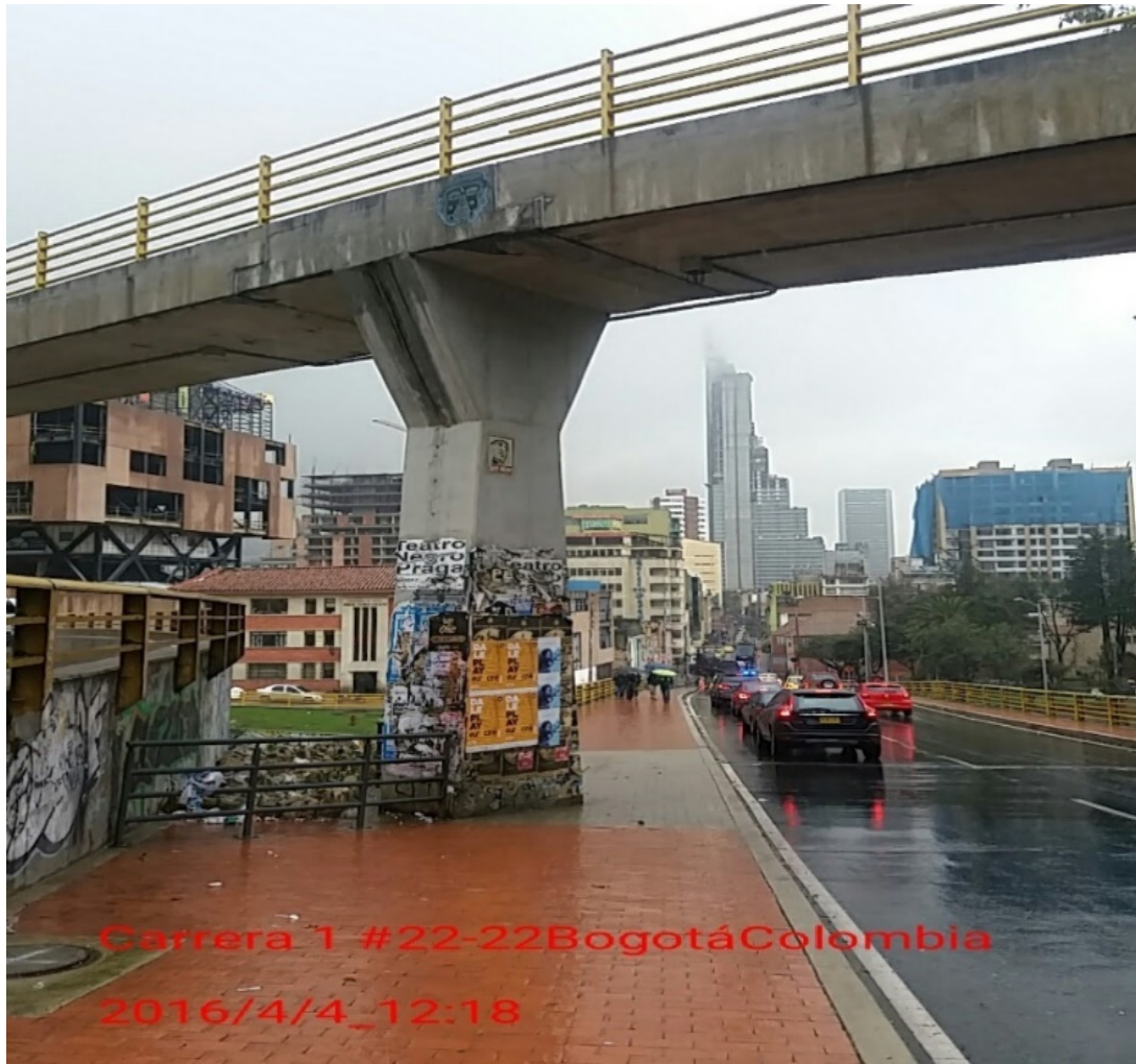
Fotografía 1. Columna Puente de la Calle 26 con Carrera 5 sentido norte – sur