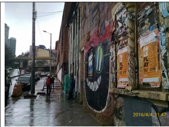
Carrera 5 No. 24-04