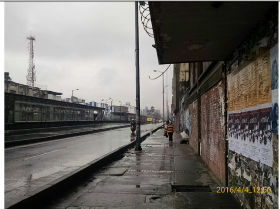
Av. Caracas con Calle 22