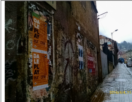
Calle 24 con Carrera 5