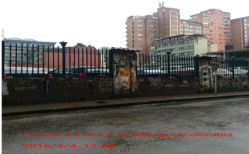
Fotografía 10. Cerramiento de la Calle 18 con Carrera 4